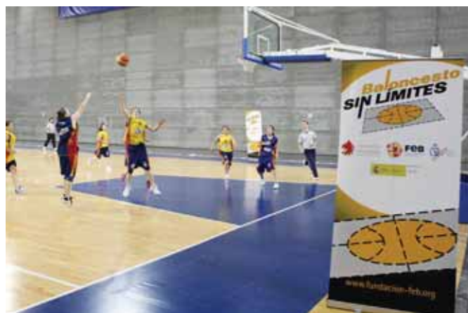
Actividad de Baloncesto Sin Límites celebrada durante el pasado Preolímpico Femenino en el Telefónica Madrid Arana.