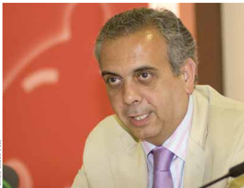
El presidente de la FEB y de la Fundación, en una de las presentaciones de actos sociales de la misma.

En efecto, el pasado mes de mayo nos convertimos en la primera fede-