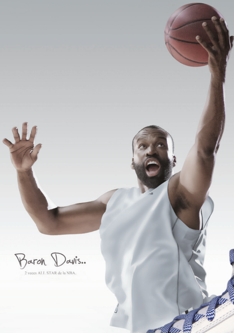
Baron Davis.. 2 veces A.I. STAR de la NBA.