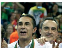
SCARIOLO: Los dos oros europeos consecutivos