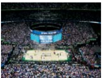
NCAA Una competición que paraliza un país