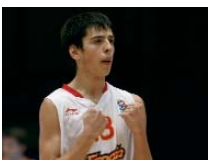
SELECCIONES Semana Santa muy activa para la formación