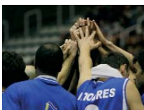
ADECCO PLATA River Andorra consigue el ascenso directo