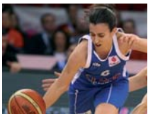
EUROLIGA FEMENINA Ros Casares se llevó la final española ante Rivas