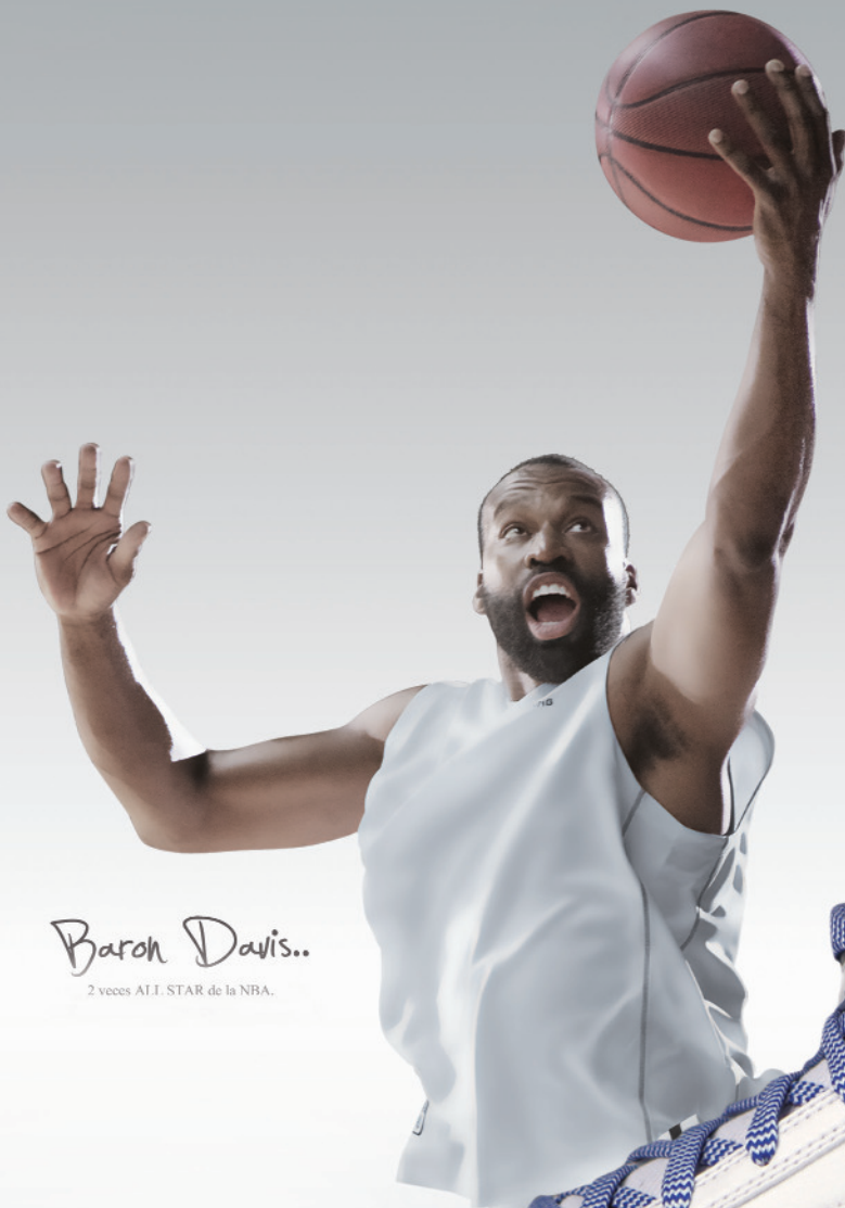
Baron Davis.. 2 veces A.I. STAR de la NBA.