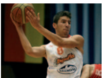
EUROPEOS DE FORMACIÓN Sorteados los grupos de los seis torneos continentales