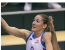
LIGA FEMENINA: Ciudad Ros Casares, el Dream Team versión 3.0