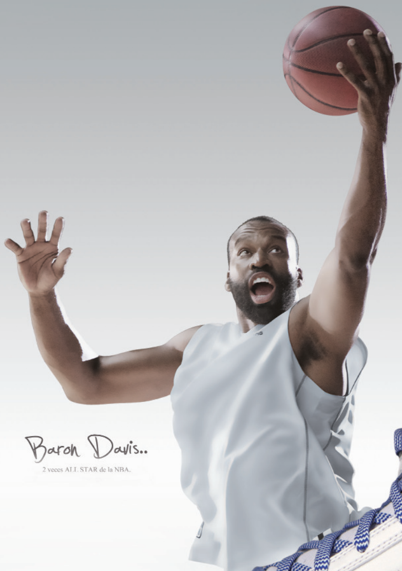
Baron Davis.. 2 veces A.I. STAR de la NBA.