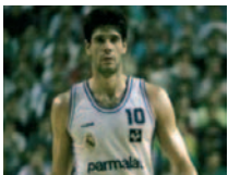
FERNANDO MARTÍN: A los 22 años, recordamos al pívot internacional