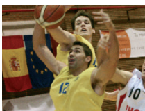
INFORME EBA: La base de la pirámide de competiciones