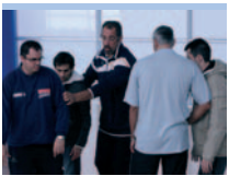
FORMACIÓN DE PÍVOTS: Curso de Especialización jugador interior