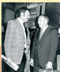
En compañía de Lolo Sainz, el entrenador de la Selección, Díaz Miguel fue el seleccionador de España en los Juegos Olímpicos de Barcelona 1992 y los Juegos Olímpicos de Atlanta 1996.

La selección seleccionador de transición en 1992, en la espera de Ed Jacovic, para ya en un momento de su vida.