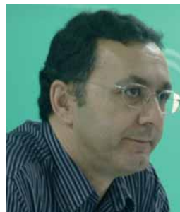
Robert Álvarez (El País)