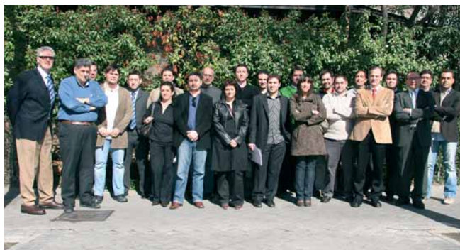
Foto de familia de los asistentes a la reunión.