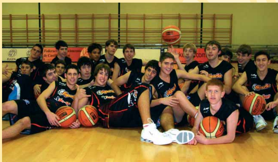
El Torneo de Iscar de estas navidades ha sido el último paso en la preparación de este grupo