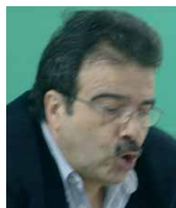
J.A. Casanova (La Vanguardia)