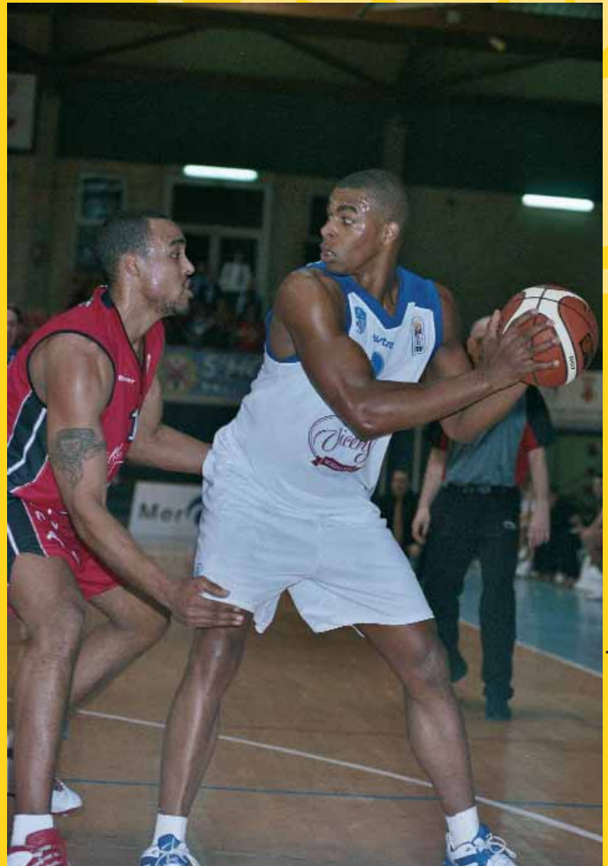
Terrell revalida el MVP de la LEB 2 de la temporada pasada en la categoría superior

Si tuviera que elegir un solo equipo mi elección sería León, también me