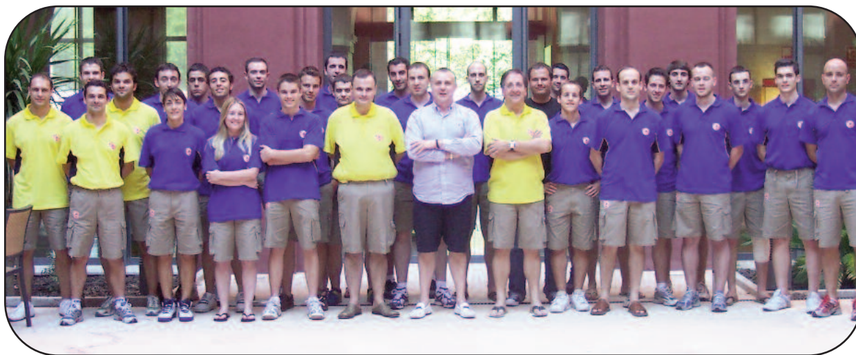
X Clinic de Formación de Árbitros, en Alcázar de San Juan

Las competiciones nacionales van tocando a su fin, y llega el momento de hacer balance y preparar la temporada 2008/09, que trae importantes novedades como los cambios en las Reglas de Juego. Con estos objetivos, la Federación Española de Baloncesto ha convocado, como cada verano, los Clinic de Árbitros de Zona LEB y de árbitros jóvenes, así como la reunión de responsables de Comités Territoriales de Árbitros.