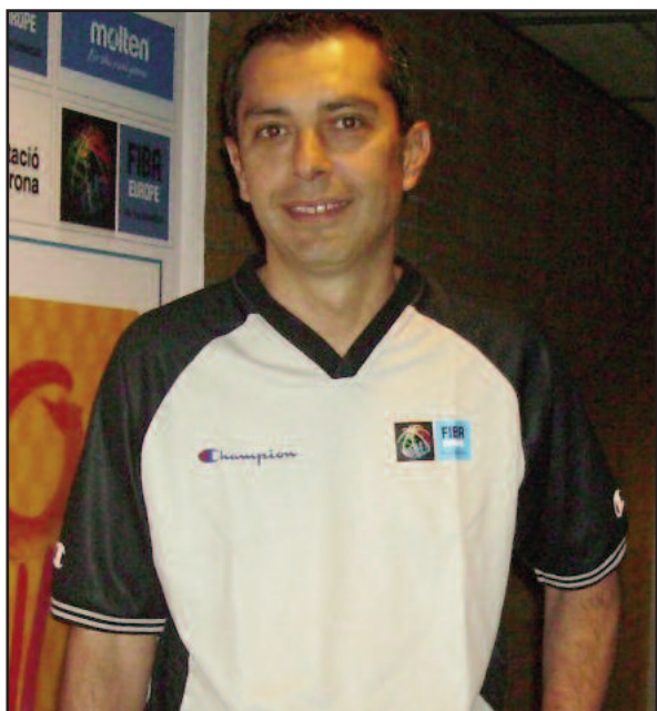
Juan Carlos Arteaga

El árbitro internacional canario Juan Carlos Arteaga ha sido designado por FIBA para los Juegos Olímpicos de Beijing 2008. “Nunca te imaginas cuando empiezas llegar a este punto. Con esta designación se completa la trilogía que empezó en el Mundial y continuó en el Europeo” - afirmaba tras conocer la noticia.