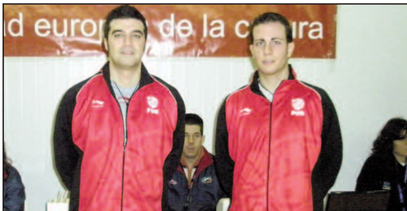
Árbitros antes de un partido en Cáceres

Asimismo se trabajó en la grabación y edición digital de encuentros, con la finalidad de que las jugadas representativas de cada arbitraje pasaran a formar parte de la base de datos de seguimiento arbitral FEB, que ya supera las dos mil situaciones de juego registradas esta temporada, sólo en Liga EBA y LEB Bronce.